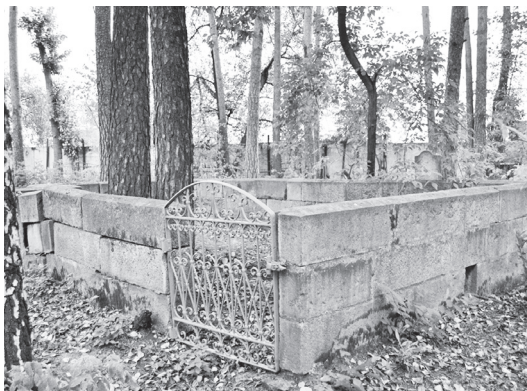
● 1879 елгы зират.