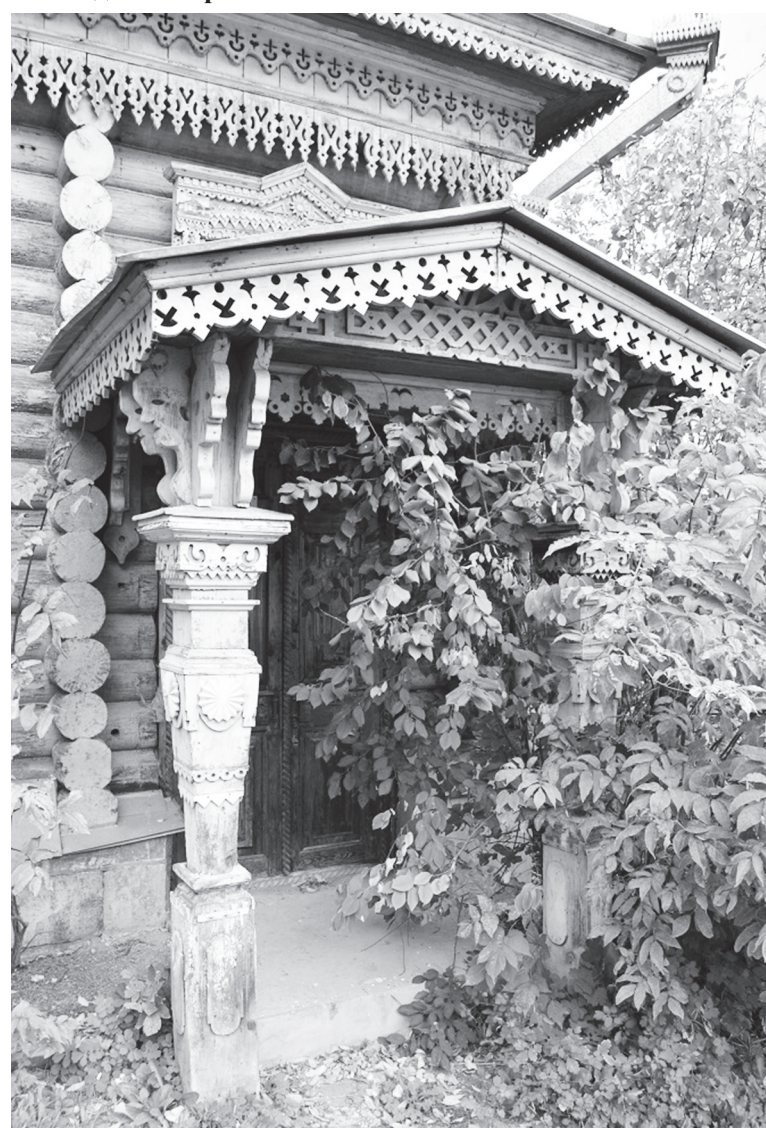
● Челтәрле дә бизәкле...

Репин урамы – 42 адресы буенча 1879 елда ачылган, даими вәкилләктән дүрт чакрым ераклыкта урнашкан татар зи-