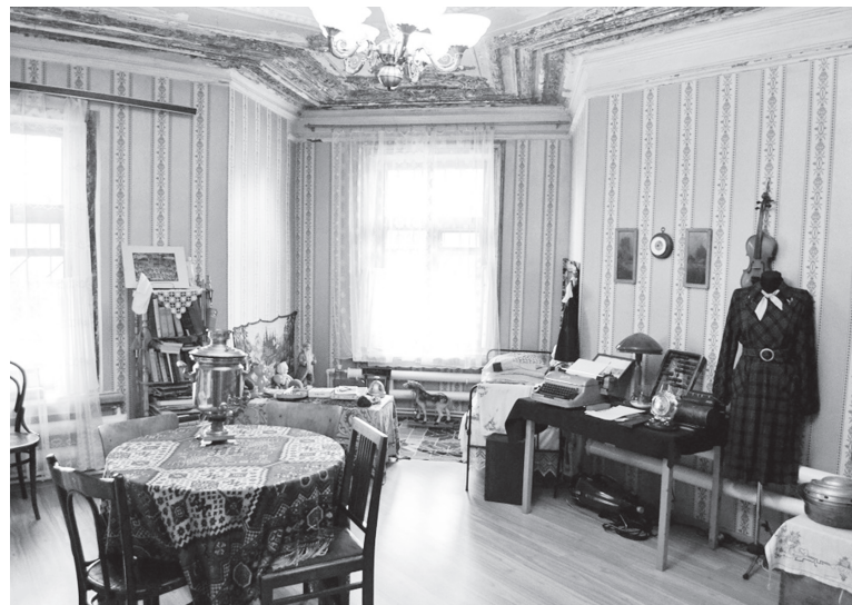
● Монда байлар яшәгән.