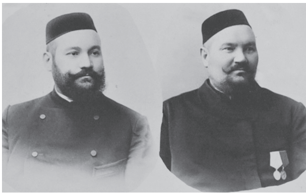
● Татар сәүдәгәрләре.